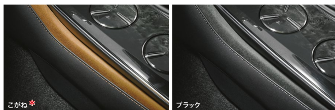
コンソールサイド (グランリュクス® 巻き)