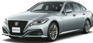
SILVER ME.<1F7> シルバーメタリック