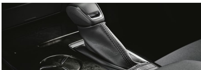
シフトブーツ (ブラックステッチ)