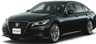
PRECIOUS BLACK PEARL<219> プレシャスブラックパール メーカーオプション