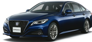
DK. BLUE MC.<8S6> ダークブルーマイカ

■写真は特別仕様車HYBRID 2.5 S"Elegance Style" [ベース車両はS(2.5Lハイブリッド車)].