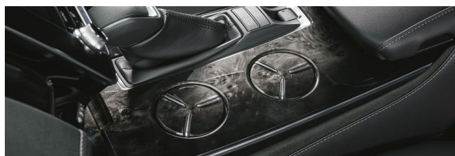
センターコンソールパネル (黒木目 [櫻調])