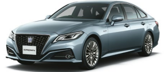
PRECIOUS GALENA<1K5> プレシャスガレナ メーカーオプション