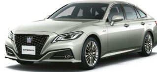
PRECIOUS SILVER<1J6> プレシャスシルバー メーカーオプション