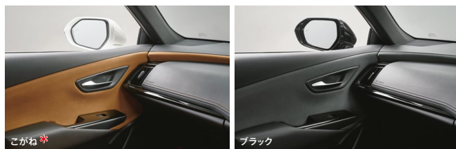
ドアトリム & インストルメントパネル (グランリュクス® 巻きオーナメント表皮)