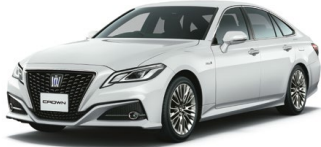
WHITE PEARL CS.<062> ホワイトパールクリスタルシャイン メーカーオプション