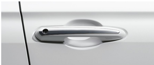
アウトサイドドアハンドル (メッキ)