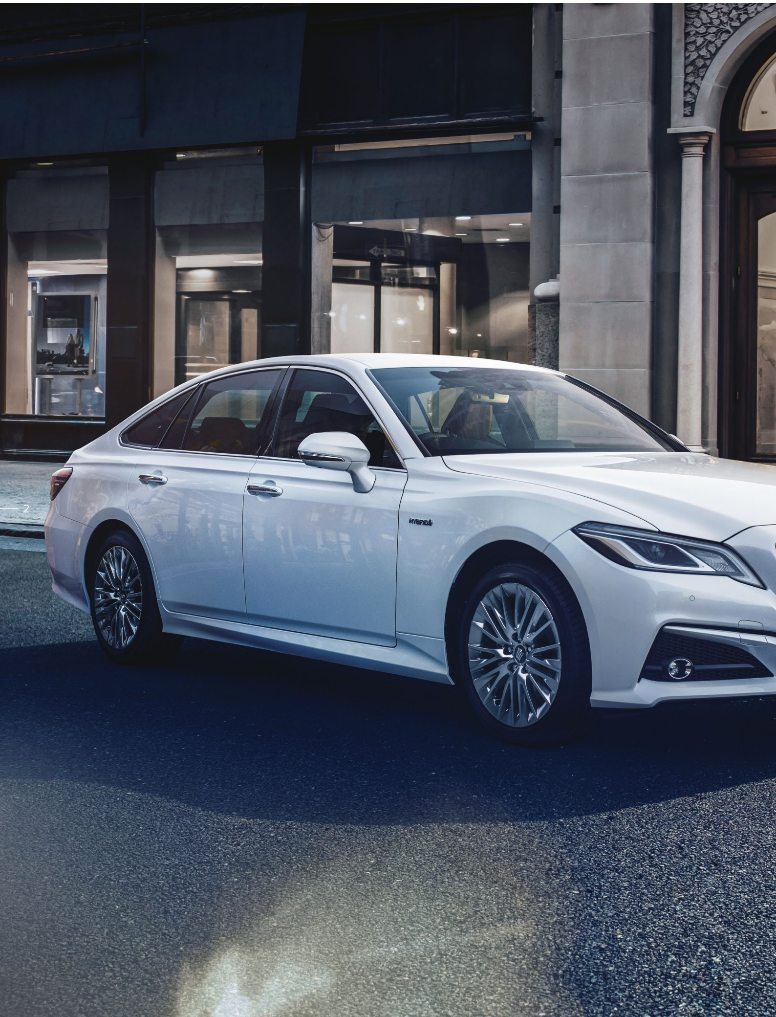
Photo : 特別仕様車HYBRID 2.5 S* Elegance Style* [ベース車両はS (2.5Lハイブリッド車)]。ボディカラーのホワイトパールクリスタルシャイン<062>はメーカーオプション。 内装色のこがねは設定色 (ご注文時に指定が必要です。指定がない場合はブラックになります)。 ■写真は合成です。