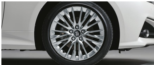
18インチノイズリダクションアルミホイール (ハイパークロームメタリック塗装) & センターオーナメント